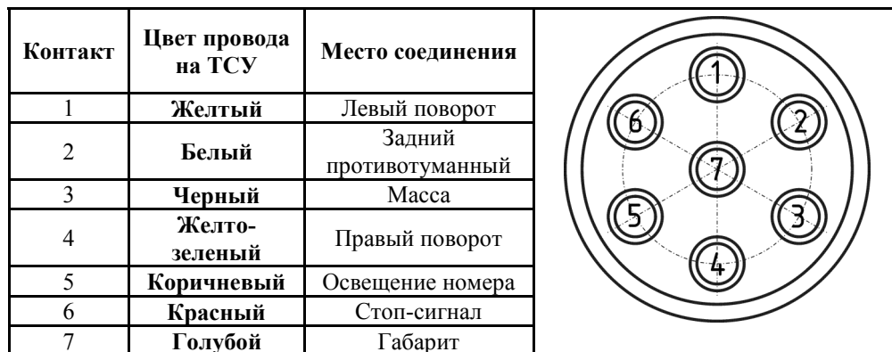
СХЕМА МОНТАЖА ТСУ