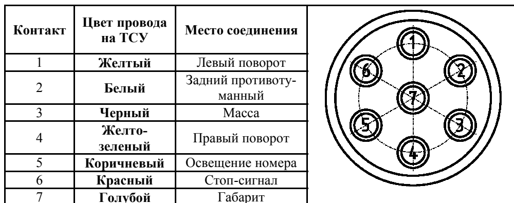
СХЕМА МОНТАЖА ТСУ