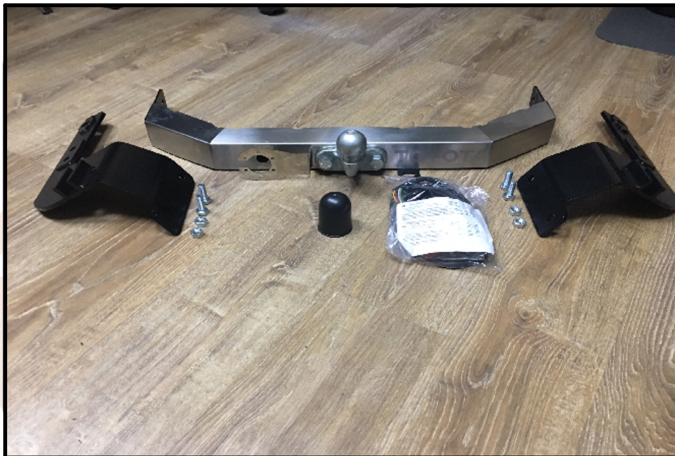
Фаркоп арт. TCU00046