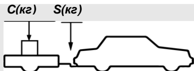
верное размещение груза